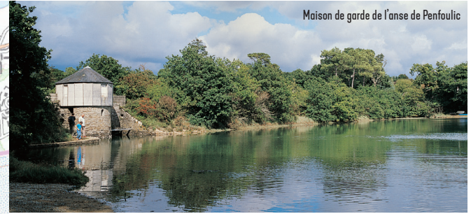
Maison de garde de l'anse de Penfoulic